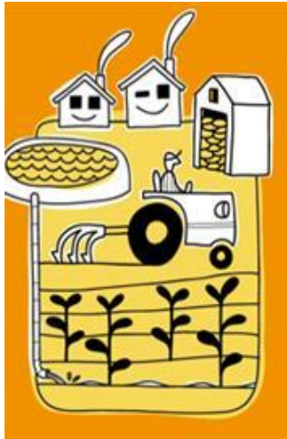
Sistemas de producción sostenible